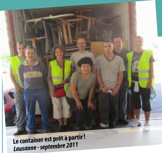
Le container est prêt à partir! Lausanne - septembre 2011

Un examen d'entrée a été organisé durant les vacances scolaires pour recruter les petits de 1 re année et permettre à 16 autres élèves de rejoindre l'école et combler les places disponibles. Force est de constater que l'écart se creuse de plus en plus entre les élèves du Centre et leurs camarades des écoles publiques ou privées voisines. C'est à la fois une très bonne nouvelle qui illustre la qualité de l'enseignement mais en même temps, nous avons dû établir de nouvelles dispositions. Désormais, pour éviter un rattrapage trop important et trop de stress aux nouveaux venus, nous ne pourrons malheureusement plus recruter d'élèves après la classe de 5 e (CM2). 🌟