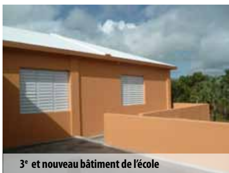
3 e et nouveau bâtiment de l'école