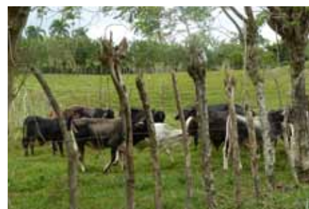
Le nouveau cheptel – Poso Hondo - septembre 2011

A noter qu'il s'agit d'un élevage biologique, hormis les vitamines et les